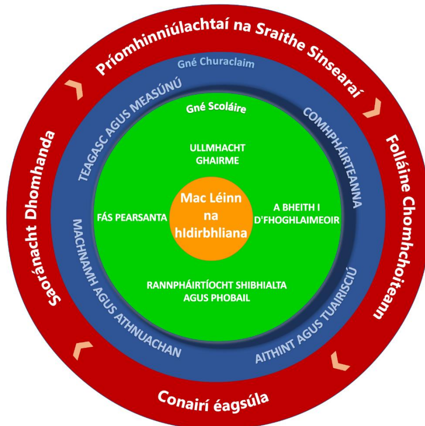
Fíor 3 Forléargas ar Ráiteas an Chláir Idirbhliana

Tá léiriú i bhFíor 3 ar lárnacht an scoláire IB agus na nGnéithe Scoláire d'fhorbairt clár IB laistigh den tsraith shinsearach. Is ionann clár éifeachtach IB, rud a bheidh uathúil i ngach scoil, agus clár ina bhfeidhmíonn gach gné den churaclam chun an scoláire a fhorbairt i gcomhréir leis na Gnéithe Scoláire.