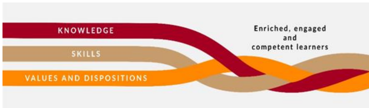
Fíor 1 Comhpháirteanna na bpríomhinniúlachtaí agus an tionchar a mhianaítear leo

Is scáth-théarma é Príomhinniúlachtaí 1 lena ndéantar tagairt don eolas, na scileanna, na luachanna agus na meonta a fhorbraíonn an scoláire le linn na sraithe sinsearaí. Is doimhne an fhoghlaim nuair a fhéadann sé a chuid eolais, scileanna, luachanna agus meonta a chomhtháthú agus a chur i bhfeidhm i réimse de thascanna, comhthéacsanna, cásanna agus teagmhais éagsúla.